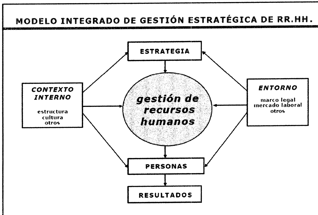
Figura N° 1. Modelo Integrado de Gestión Estratégica del Recurso Humano

La Planeación Estratégica del Recurso Humano o Modelo Integrado de Gestión Estratégica del Recurso Humano, es un sistema integrado de gestión, que consta de lo siguiente: