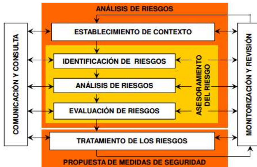
Figura 1 Proceso para la administración del riesgo.