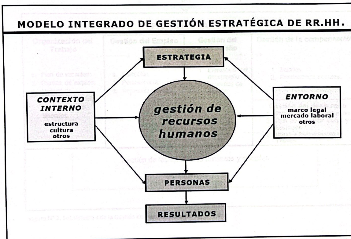
Figura N° 1. Modelo Integrado de Gestión Estratégica del Recurso Humano

La Planeación Estratégica del Recurso Humano o Modelo Integrado de Gestión Estratégica del Recurso Humano, es un sistema integrado de gestión, que consta de lo siguiente: